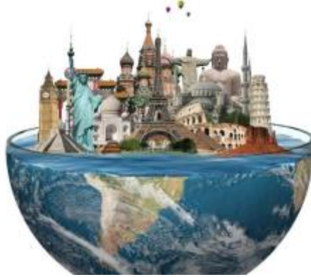
2 - Seyahat Acenteciliği