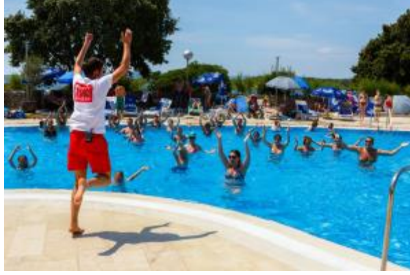
3 - Animatörlük