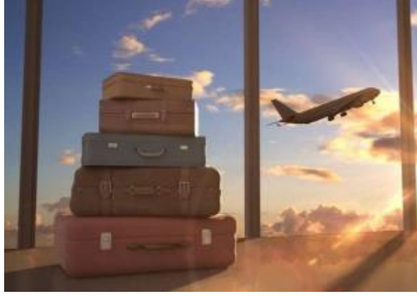
1 - Konaklama Hizmetleri